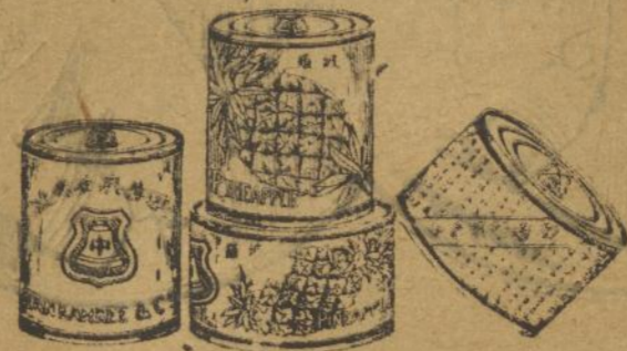
頭 梨 黃